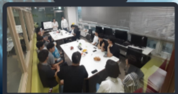
상반기 입소생 간담회