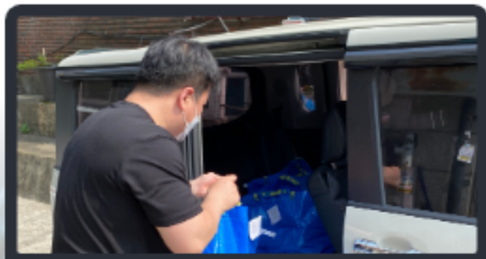
월드비전 (도시락, 월세지원)